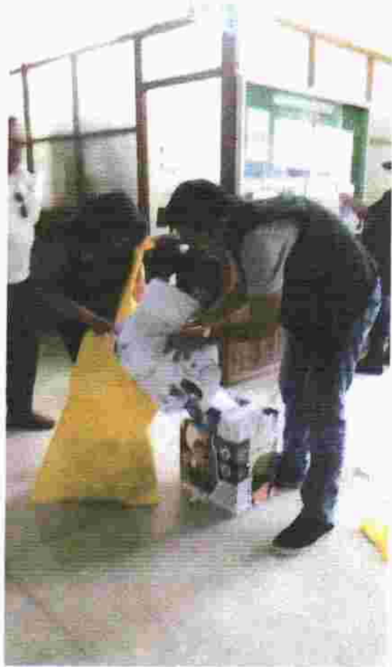
Foto N°3. Recajo de residuos sólidos inorgánicos (Gerencia de Infraestructura y desarrollo Local-Subgerencia de Patrimonio y Margesf de bienes)