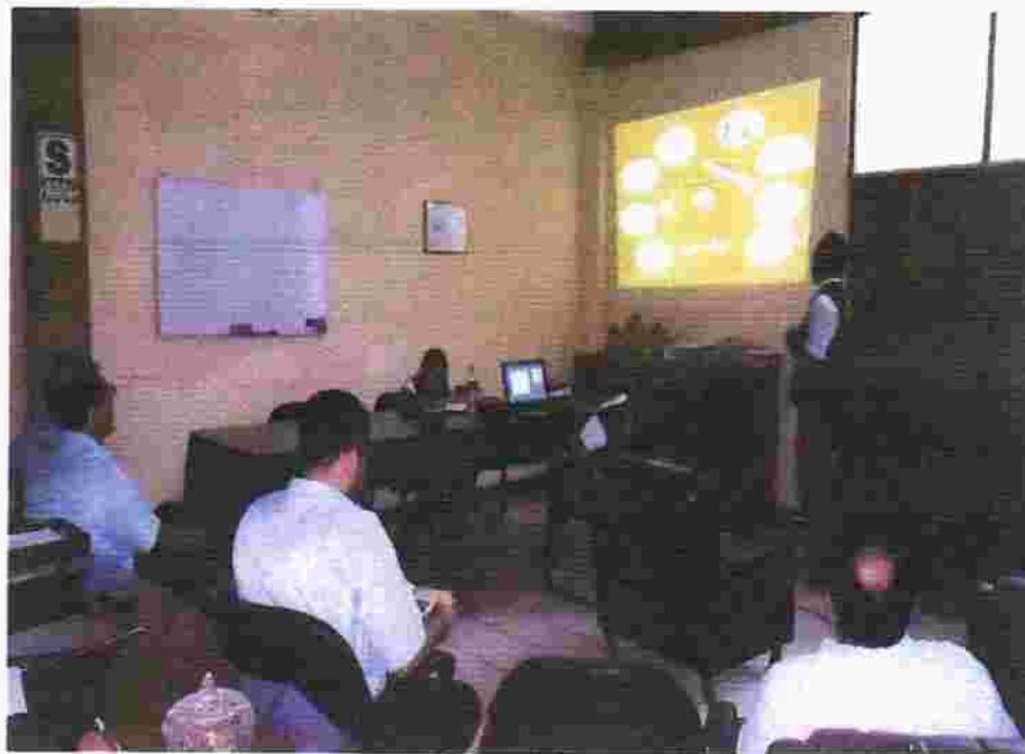
Foto N°1. Exposición de segregación de residuos sólidos – Gerencia Municipal