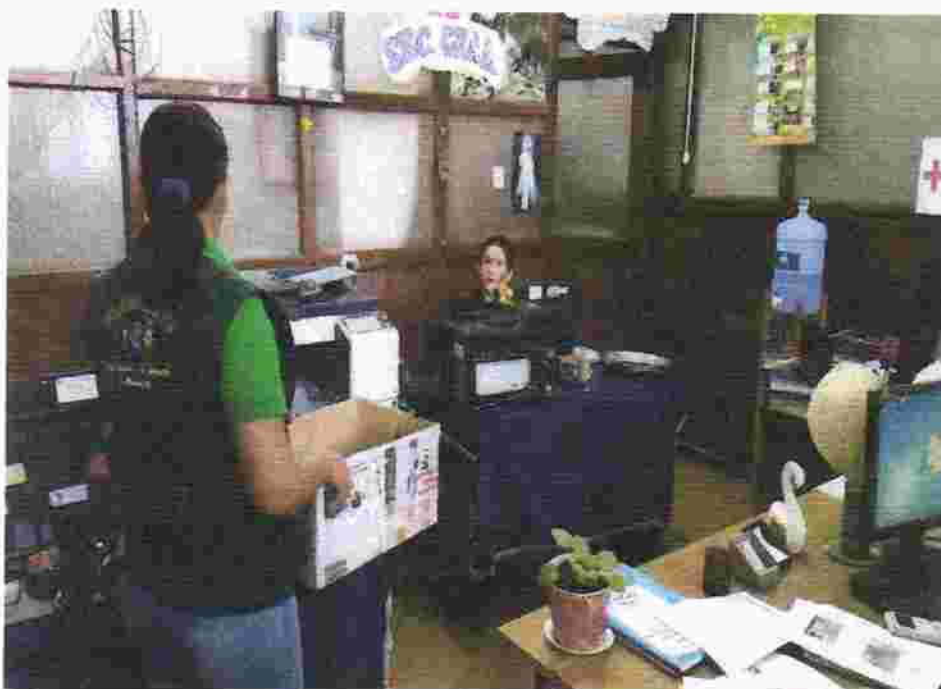
Foto N°2. Colocación de dispositivos para residuos sólidos inorgánicos – Gerencia Municipal