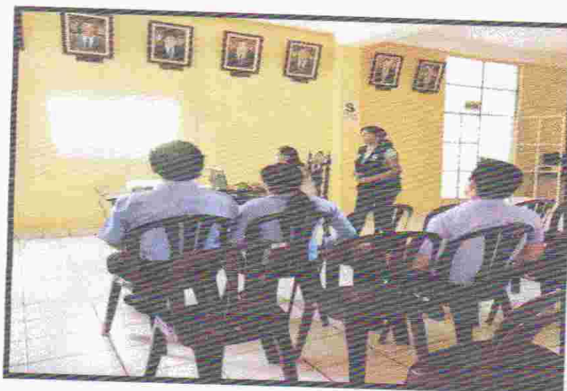
Figura 01. Charla de Ecoeficiencia en la MPLP.